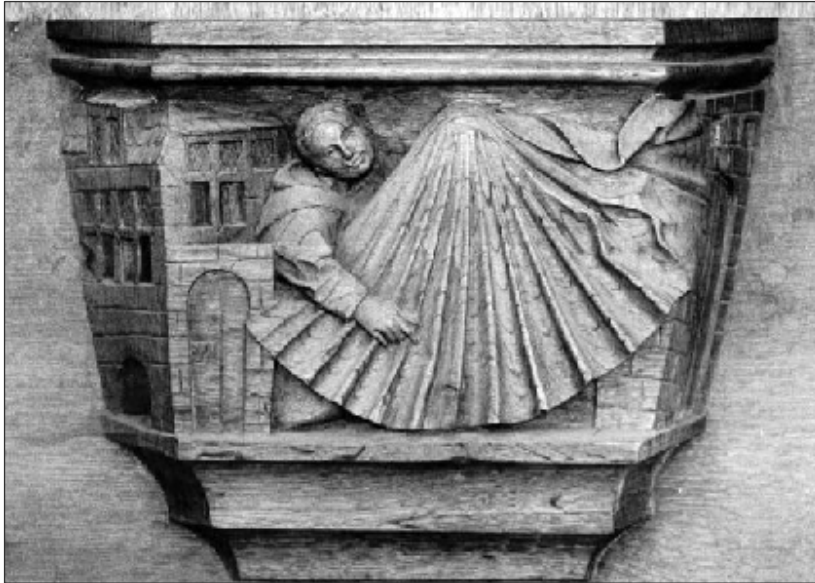
Koorstoel in de kerk van Hoogstraten, Monnik met huik

Bij de duivel te biecht gaan Bij iemand in het krijt staan Daar hangt de schaar uit Daar hangt het mes uit Daar staan klompen Daar steekt meer in dan een enkele panharing Daar zijn de daken met vlaaien bedekt Dat hangt als een schijthuis boven de gracht De beren zien dansen