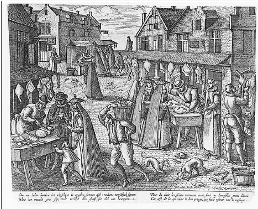
Vrouwen gekleed in huik doen boodschappen bij de beenhouwer . De huik wordt bekroond met een parapluvormig hoedje met pluim.

springen Veel geschreeuw en weinig wol Voor wint ist goet seylen Waar aas is vliegen kraaien Wat heb je aan een mooi bord als het leeg is? Wie weet waeromme die ganzen bervoets gaan? Wilde beeren, die sijn by den ander gheeren Zij hangt haar man de blauwe huik om Zijn gat aan de poort vegen Zijn geld in het water gooien Zijn huik naar de wind hangen Zijn licht ergens op laten schijnen Zijn pijlen verschieten