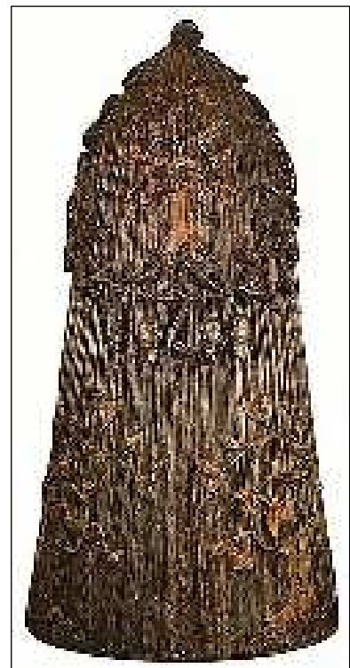
Een houten schandhuik uit 1688, met gebeeldhouwde padden en slangen: symbolen van slecht gedrag. In Den Bosch werden vrouwen van lichte zeden in dit

Een meer lugubere huik was de houten ton met aan de bovenzijde een gat, waardoor het hoofd van de gestrafte gestoken kon worden. Hij droeg de ton dan op zijn schouders. Tot in de 18 e eeuw was in Nederland de straf in zwang, dat de veroordeelde een bepaalde tijd met die huik(ton) op zijn nek rond moest lopen.