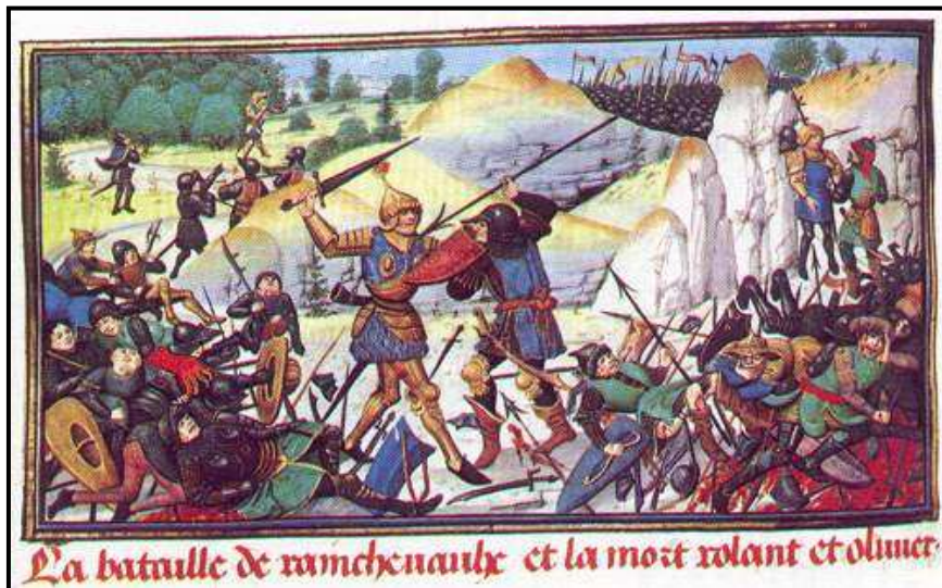
La bataille de Ronchevaux et la mort roland et oliver.

Het Hogeland, waarvan de naam Hoogland is afgeleid, was oorspronkelijk een verzamelnaam voor een aantal buurtschappen, gelegen op de hoge zandgronden in het noorden van de Gelderse Vallei. Het is het overgangsgebied naar de Eemlandse lege (=lage) landen, de polders in het noorden van Hoogland. De gerechten Hoogland en Emiclaer werden in 1811 samengevoegd tot de gemeente Hoogland. In 1857 werden de minigemeenten Duist, de Haar en Zevenhuizen geannexeerd. In 1974 was het Hoogland zelf, dat grotendeels opging in de gemeente Amersfoort; het gedeelte ten noorden van de A1 ging naar Bunschoten-Spakenburg. Men vindt hier alle kenmerken van de Gelderse Vallei: kleinschalige, onregelmatige percelen en veel afscheidende houtwallen. Dit noemt men het kampen- of hoevenlandschap.