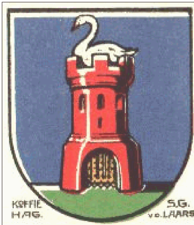
Zwammerdam heette eigenlijk Zwanendam naar het geslacht van Swaanenburg, dat hier een kasteel had. Daarom vindt je de Zwaan op de toren.